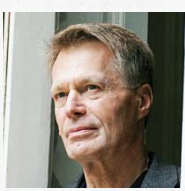
장-마리 귀스타브 르 클레지오 소설가, 노벨문학상 수상자(2008)